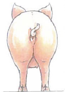
Fed (karakter 4): Hofteben og ryggrad er helt skjult.