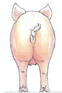
Middel (karakter 3): Hofteben og ryggrad kan mærkes via let håndtryk.